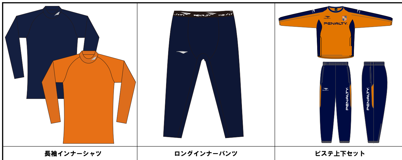
長袖インナーシャツ